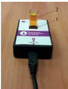
Рис. 1. Датчик оптической плотности: 1 — гнездо для кюветы; 2 — кювета для исследуемого вещества

окрашенных растворов (рис. 1). Используется при изучении тем «Растворы», «Скорость химических реакций», определении концентрации окрашенных ионов или соединений. В комплект входят датчики с различной длиной волн полупроводниковых источников света: 465 и 525 нм. Объём кюветы составляет 4 мл, длина оптического пути — 10 мм.