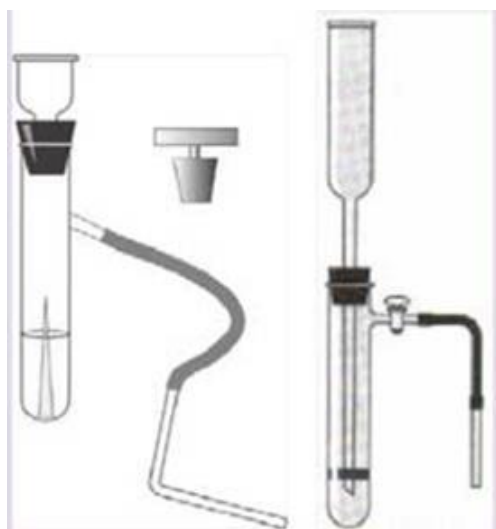
Рис.7 Прибор для получения и собирания газов

Прибор для получения газов используется для получения небольших количеств газов: водорода, кислорода (из пероксида водорода), углекислого газа